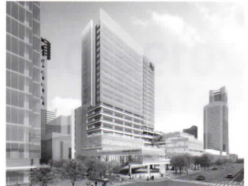
▲ 神奈川大学・みなとみらいキャンパス完成イメージ図 (2021年開設予定)