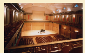
彩の国さいたま芸術劇場 音楽ホール