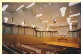
泉佐野市立文化会館 エブノ泉の森ホール 小ホール