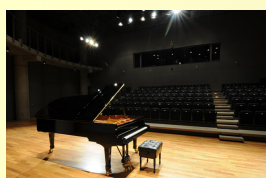
栗東芸術文化会館 さくら小ホール