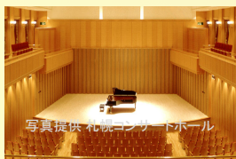
札幌コンサートホール kitara小ホール