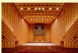
秋田アトリオン 音楽ホール