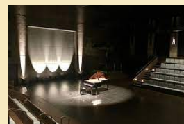
彩の国さいたま芸術劇場 小ホール