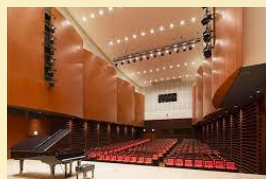
仙台市宮城野区文化センター パティナホール