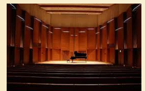
品川区五反田文化センター 音楽ホール