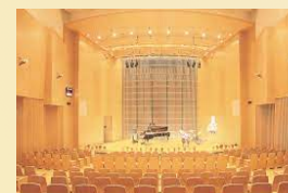
ウェルとばた 中ホール